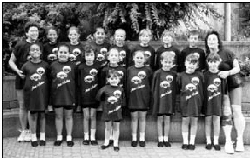
Notre fine équipe le groupe Mixte I

Cette année 2003 nous a permis de participer courant juin au Concours Cantonal de Gymnastique à St-Prex. Les enfants ont travaillé très dur depuis le mois de janvier, pour participer à cette superbe journée qui s'est bien déroulée, grâce également au soutien de tous les parents présents, que nous tenons encore à remercier.